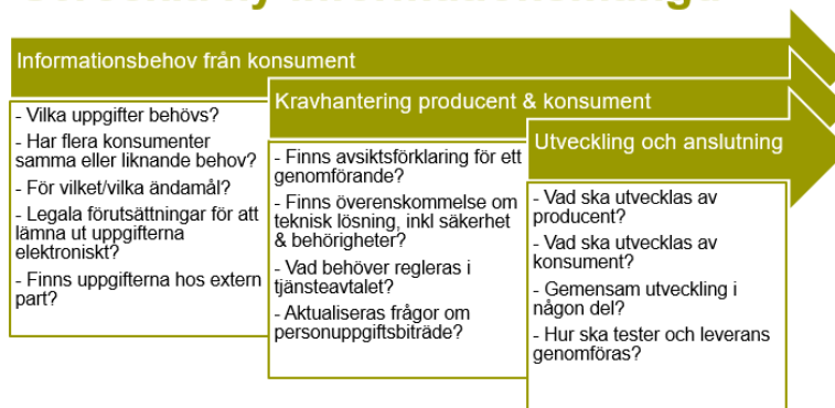
Bild: Illustration över processen att utveckla ny informationsmängd

Förstudien hämtar information från publicerade rapporter på eSams och DIGGs webbplatser samt erfarenheter från tidigare arbeten med informationsutbyte mellan myndigheter, bl a SSBTEK och SSBTGU. Analysen kompletteras med aktuella domar för att identifiera vilka frågor man måste ställa sig inför ett genomförande.